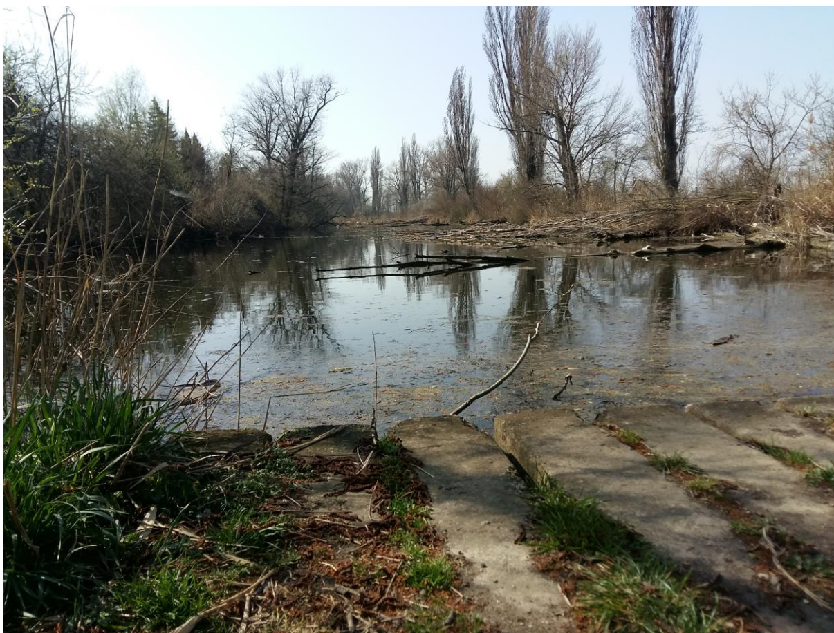
Obrázek č. 4.3.3-1